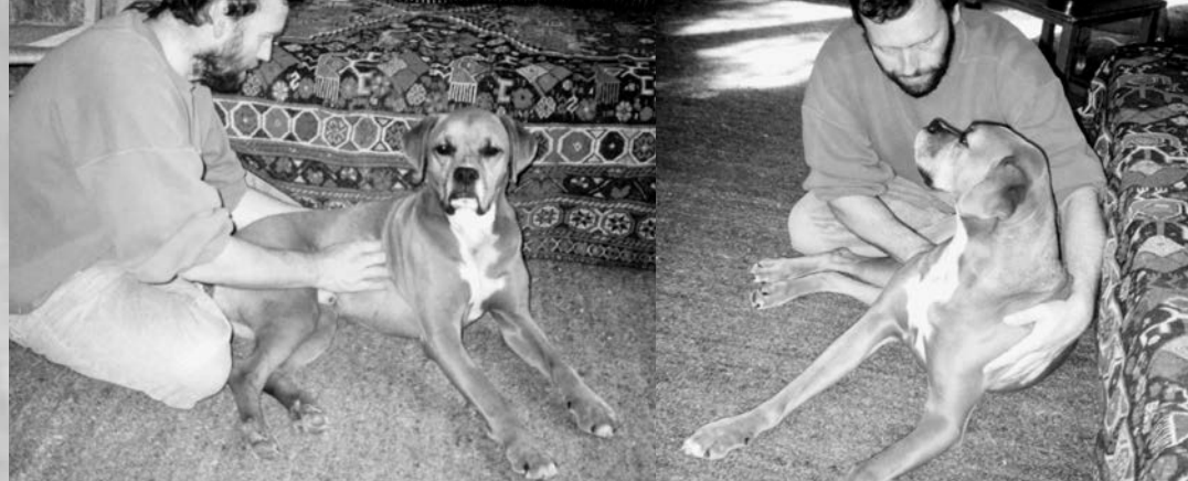
«Gespräche ohne Worte», klare Zeichen und Botschaften versteht der Hund.

Bei meiner Arbeit brauche ich die Trennung von Psyche und Physis nicht. Beides sind Abstraktionen von ein-und demselben Phänomen Leben. Ich arbeite konkret, das heisst, mir nützen abstrakte Separationen nichts. Ein Beispiel: Als ich mit Nico, einem herrlichen Boxerrüden, das erste Mal etwas zu tun hatte, litt er stark unter Schmerzen. Sein Tierarzt diagnostizierte Rheuma und verordnete, Nico sollte das Schwimmen unterlassen, dabei tat er dies am liebsten. Ich sah sein Rheuma nicht, wollte aber trotzdem sehen, wie seine Schmerzen sind und wie er diese aufrecht erhielt. Mir fielen die ausgeprägten